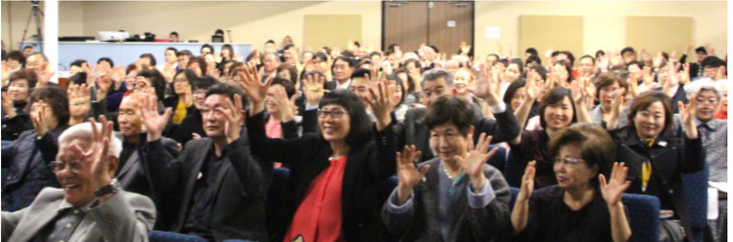
3월 18일 몬트레이팍 채플 입당감사예배 중에 성도들이 손을 들고 활짝 웃고 있다.