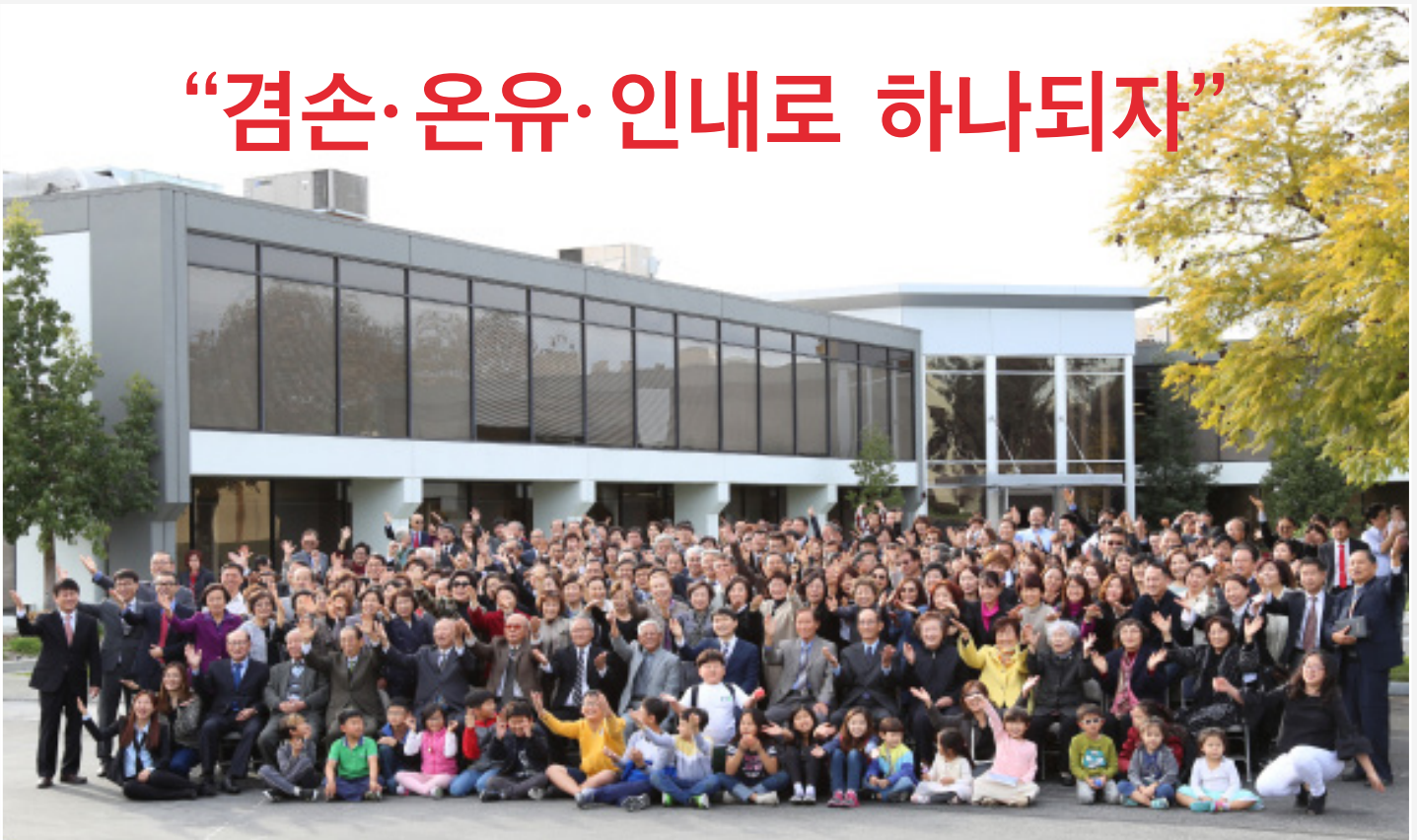
"주안예교회로 오세요" 3월 18일 몬트레이파크 채플 입당감사예배를 드린 후 새 성전 앞에 모여 기쁨을 나누는 성도들