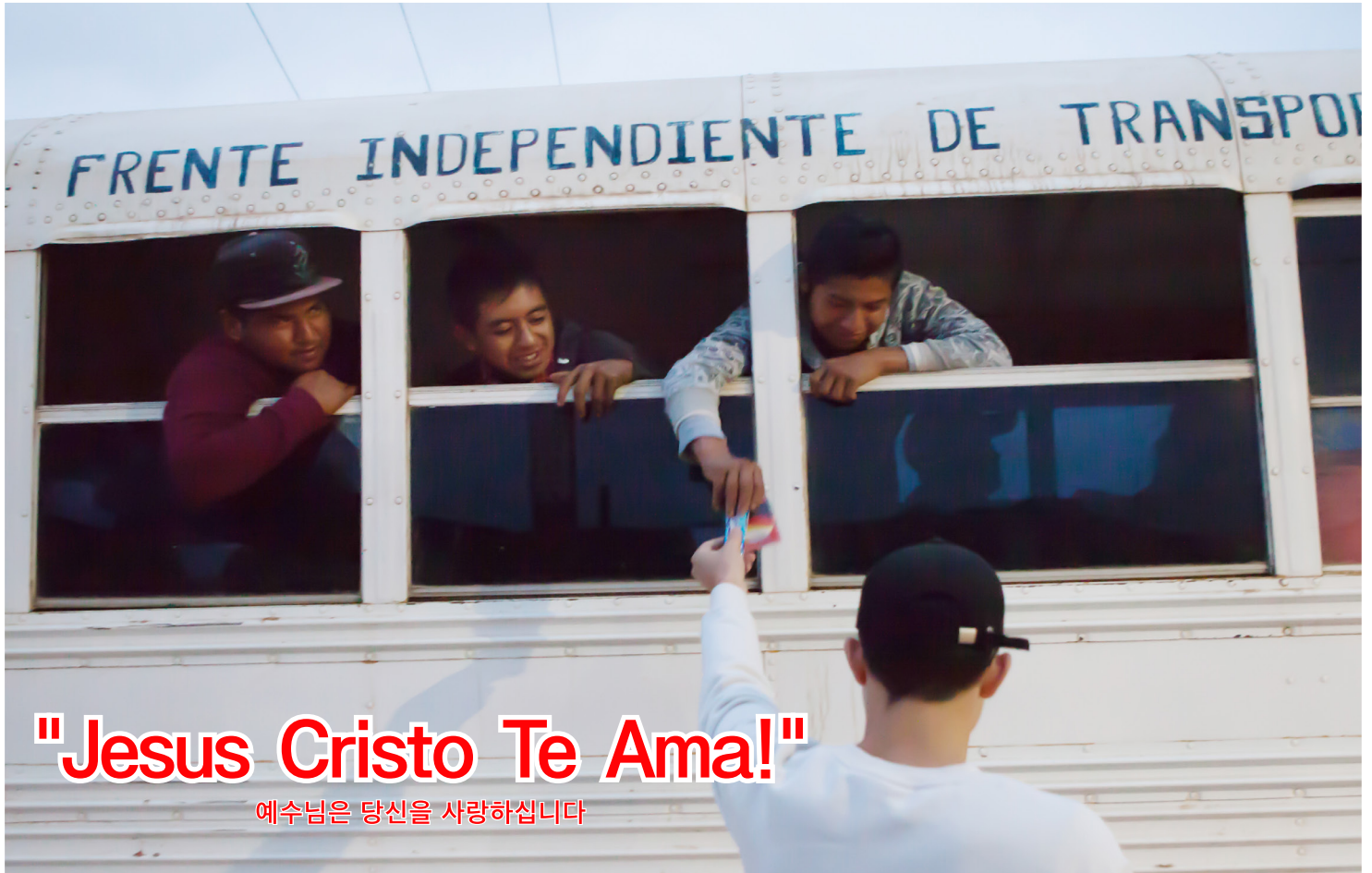
어둠이 채 가시지 않은 새벽 농장으로 향하는 인디오 노동자들, 전도지 한장을 받는 표정도 밝고 순수하다.

주안예교회 InChrist Community Church ph. 818.363.5887 | 문서국 e-mail: icccnews123@gmail.com | web: in-christcc.org