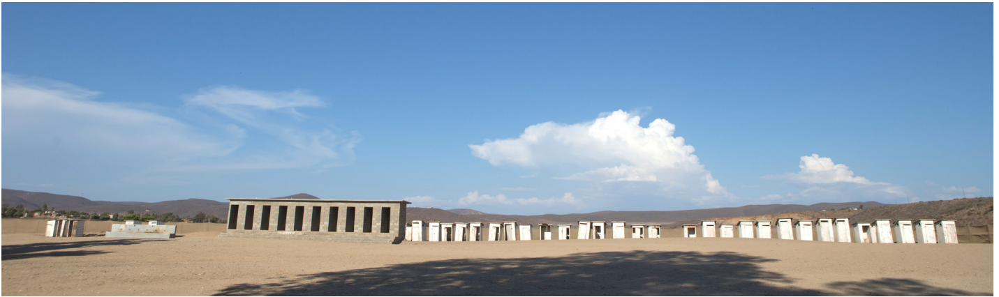
황량한 벌판에 세워진 공동 화장실과 샤워시설, 그들의 고단한 삶을 보여준다.