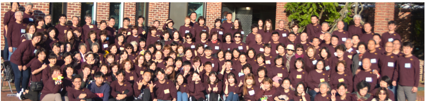
170여명의 시커스들과 서포터스들이 제1기 한국 힐링캠프를 마치고 한 자리에 모였다.