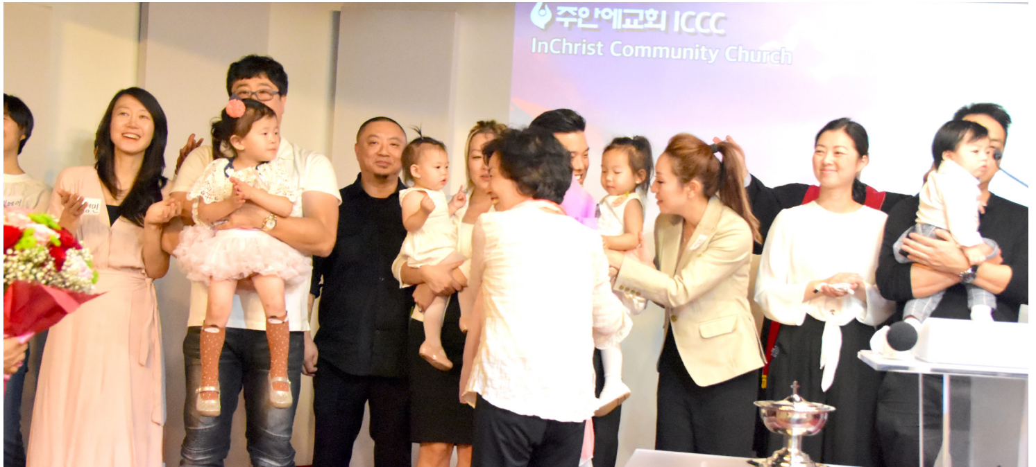
밸리채플과 MP채플에서 20여명이 세례·입교·유아세례를 받고 기뻐하고 있다.

주안예교회 InChrist Community Church ph. 818.363.5887 | 문서국 e-mail: icccnews123@gmail.com | web: in-christcc.org